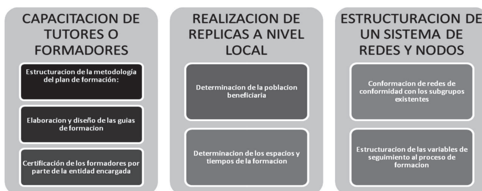
Gráfica 3: Estructura general del proceso FDF.

La metodología FDF se presenta como óptima. Este esquema se enmarca dentro de tres fases a saber: a. capacitación de tutores o formadores; b. Realización de réplicas en diferentes sectores; c. Estructuración de un sistema de redes y nodos.