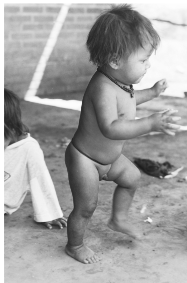
Figura N° 2: niño Mbya dando los primeros pasos solo

Con relación a ello, la oportunidad, características y frecuencia de movimientos y desplazamientos dependen de las características del espacio en el que el niño o niña puede y/o quiere moverse, lo que hace posible entender en qué circunstancias los cuidadores y cuidadoras permiten o restringen sus desplazamientos. Al respecto, existen ocasiones en las cuales se limita intencionalmente el desplazamiento del niño o niña, y es cuando se considera que puede existir un riesgo para él o para ella, o cuando el cuidador o cuidadora no puede abandonar la tarea que está realizando para seguir sus movimientos. No obstante, en general los padres y las madres permiten que sus niños y niñas se desplacen y se muevan a través del patio y de los alrededores de la casa. Excepto durante el sueño, cuando los lactantes permanecen dentro del ky’á (hamaca) por algunas horas (Ver figura N° 2), no hay ningún otro objeto o construcción que sirva a los fines de restringir el movimiento de los niños y niñas. Por el contrario, cuando comienzan a reptar o gatear se les permite “explorar” el entorno durante sus desplazamientos, los que al comienzo son cortos y atentamente vigilados por sus cuidadores y cuidadoras. Asimismo, si bien se asiste a los niños y niñas durante sus primeros pasos, se deja libertad para que ensayen el equilibrio y la marcha sosteniéndose de diferentes elementos disponibles en el espacio de la galería o patio, como así también del cuerpo de otras personas.