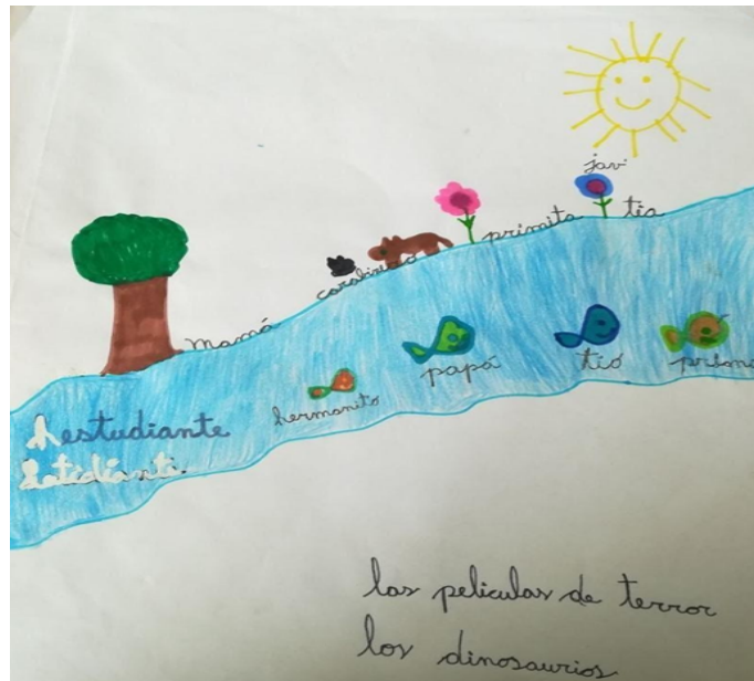
Figura 1 Dibujo A

Nota. El pichikeche dibuja a las personas más importantes para él y las figuras que le generan miedo. Entre ellas destaca a los carabineros y lo expresa en su dibujo como una mancha negra, lo cual lo relata al explicar el contenido del dibujo.