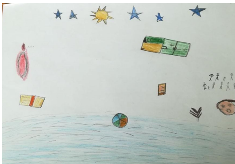
Figura 3 Dibujo C

Nota. El pichikeche indica que en la parte izquierda del dibujo está quemando a los carabineros, ya que les tiene miedo y refiere «Me caen mal». Al lado derecho del dibujo está su familia y las cosas que le gusta hacer. Ubica en un costado marginal a la situación de violencia de la que ha sido objeto.