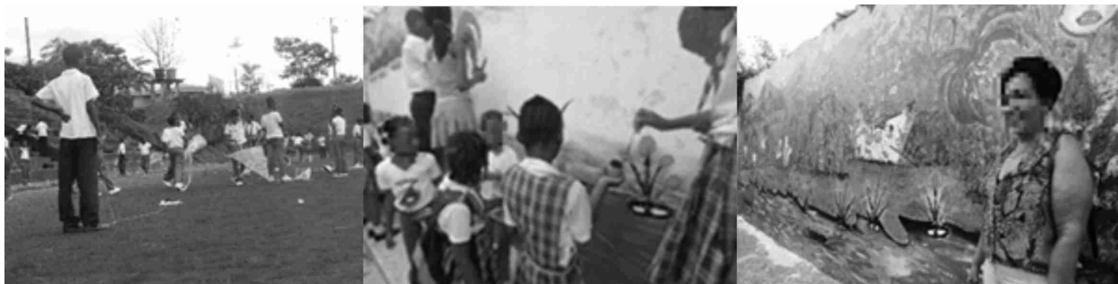
Gráfico 28, 29 y 30: Transformando nuestro mundo.