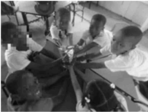
Gráfico 24: Trabajando en grupo.