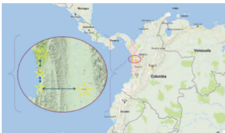
Figura 1. Lugares donde se realizó la investigación.