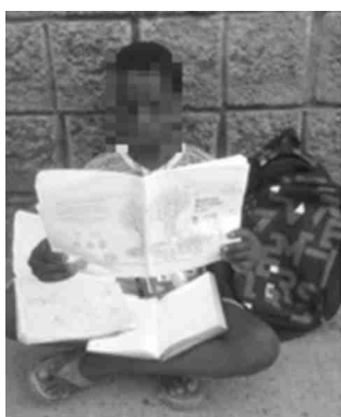
Autor: Ronald Fernando Quintana-Arias.