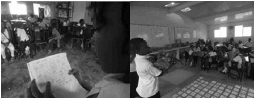
Gráficos 25 y 26: Narrando nuestras historias.

Las historias de los niños y niñas estuvieron cargadas de percepciones antropocéntricas rezagadas culturalmente: “... y el águila salía de la casa a pescar para poderle dar de comer a sus hijos, mientras la mamá se quedaba en casa...”; cabe resaltar que desde este momento los estudiantes decidieron identificarse como Águilas y Cóndores, los grupos más representativos desde la actividad de las canciones (gráficos 25 y 26).