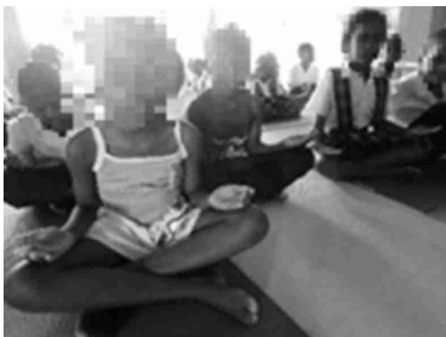
Gráfico 27: Buscando la paz interior.

espacio-temporales” p. 59 y el adiestramiento en adquisición de movimiento, ritmo y secuencia kinestésica, focalizan la atención en el cuerpo junto con el control y selección de estímulos externos, así como su relación con el desarrollo de la Comunicación no verbal (Ramírez, 2007).