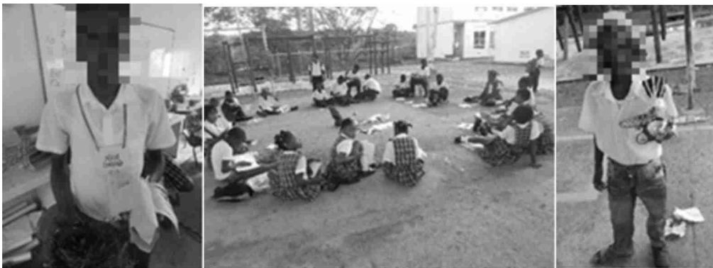
Autor: Ronald Fernando Quintana-Arias.

Asimismo, la actividad promovió la habilidad de desarrollo físico biológico al enfatizar la destreza manual; la habilidad socio-emocional, a partir de la espontaneidad, de la socialización, del placer, de la satisfacción, de la expresión de sentimientos y de la confianza en sí mismos. Finalmente, la habilidad de desarrollo cognitiva-verbal se consiguió al fomentar la imaginación, la creatividad, la agilidad mental, la memoria, la atención, el pensamiento creativo, el lenguaje, la interpretación de conocimiento, la comprensión del mundo, el pensamiento lógico, el seguimiento de instrucciones, la amplitud de vocabulario, así como la expresión de ideas.